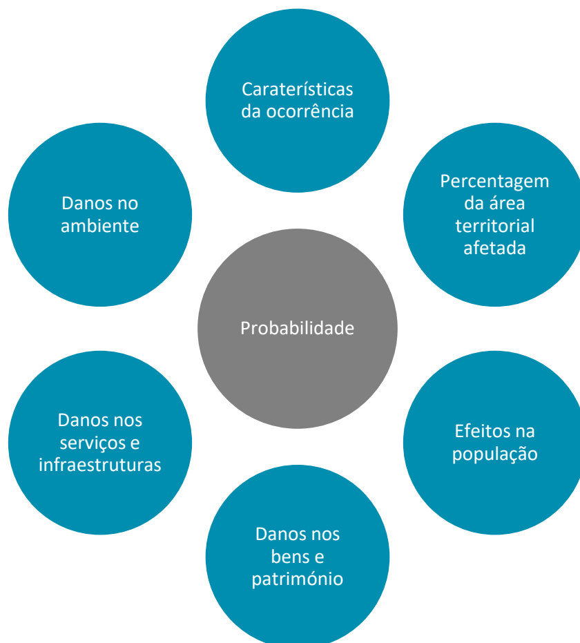
Figura 3 – Critérios para a ativação do PMEPCAF

Os critérios antes mencionados constituirão a base para a identificação do nível de alerta do plano, como tal devem ser analisados individualmente quer no que diz respeito ao grau de probabilidade quer ao grau de gravidade, conforme a figura seguinte: