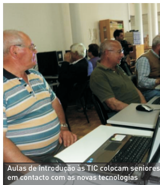
Aulas de introdução às TIC colocam seniores em contacto com as novas tecnologias