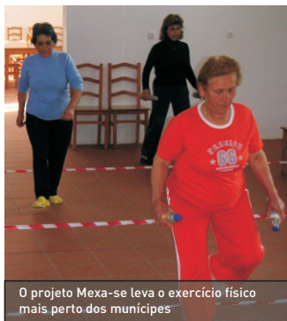
O projeto Mexa-se leva o exercício físico mais perto dos munícipes