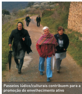
Passeios lúdico/culturais contribuem para a promoção do envelhecimento ativo